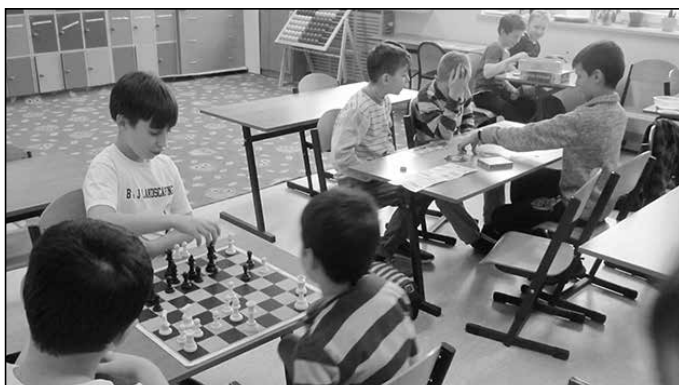
Dzieci odpoczywały twórczo i kreatywnie,

W zajęciach, które odbywały się od 13 do 17 lutego 2017 roku uczestniczyło 110 uczniów z klas od 0 do 6 szkoły podstawowej, a także kilkoro uczniów z gimnazjum. Zajęcia przygotowało i przeprowadziło 14 nauczycieli oraz 1 koordynator. Utworzono jedenaście grup uczestników przy podziale uwzględniając wiek uczniów. Codziennie od poniedziałku do piątku w godz. 7:00 do godz. 17:00 dzieci miały zapewnioną opiekę, dwa posiłki oraz wiele ciekawych zajęć min.: plastycznych, sportowych, językowych, historycznych, informatycznych, ekologicznych, kulinarnych, tanecznych i wiele innych.