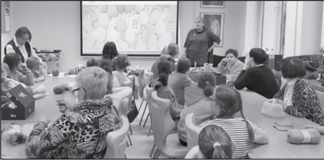
Wolontariusze robią coraz większe postępy w szydełkowaniu