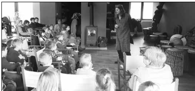
W Muzeum Baśni, Bajek i Opowiadań