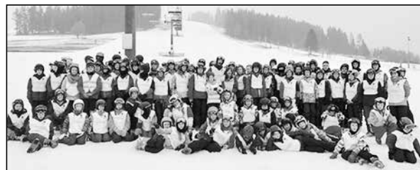
Liczna grupa dzieci z Zalesia Górnego