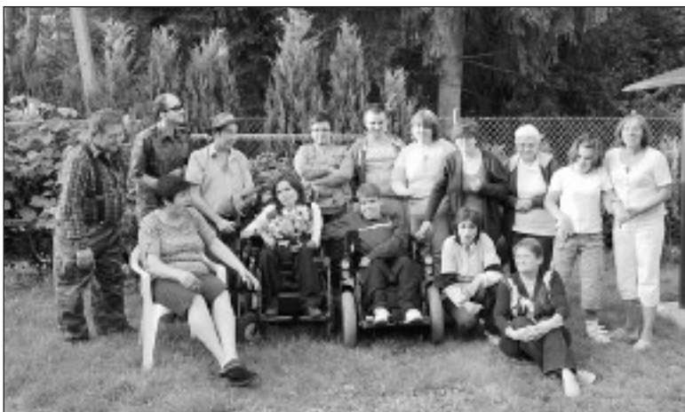
Stowarzyszenie Razem Lepiej

Od ponad dwóch lat na terenie Zalesia Górnego działa grupa, która od maja br. jest zarejestrowana jako stowarzyszenie „Razem Lepiej”. W ostatnim czasie działania grupy były dość intensywne. Postaram się opisać najważniejsze z ostatnich wydarzeń.