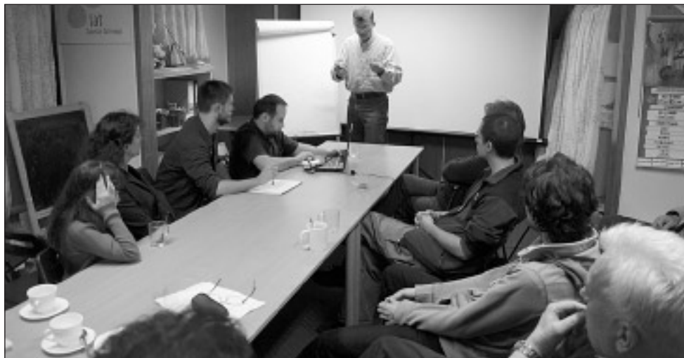
Merytoryczna debata obywatelska