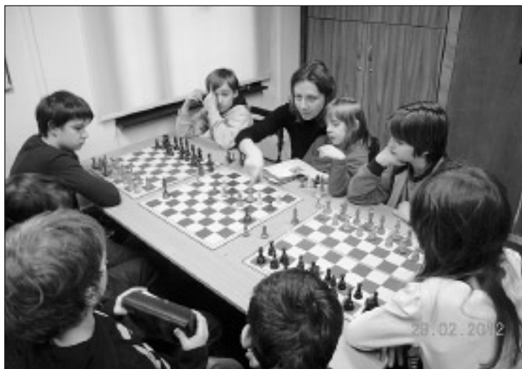
Naszych młodych szachistów szkolą najwybitniejsi polscy arcymistrzowie.

W razie pytań lub sugestii służę pomocą. Łukasz Kamiński – radny