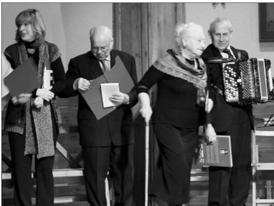
Wspaniały kresowy wieczór w naszym kościele parafialnym

To wyraz tęsknoty za dzieciństwem, rodzinnymi stronami, ulotnymi smakami i zapachami, stronami, do których już nie można powrócić. Ten motyw przewijał się przez wszystkie utwory recytowane tego wieczoru. Tęskne melodie grane na har-