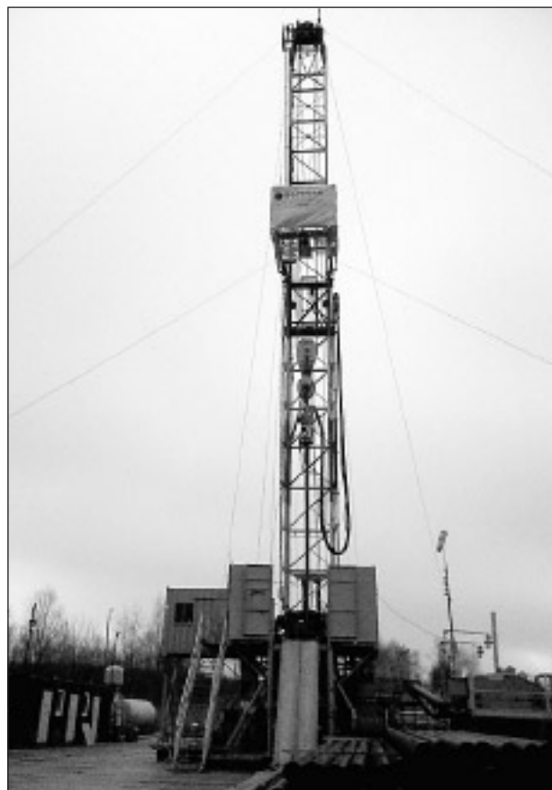
Poszukiwania taniej energii rozpoczęte

W październiku bez specjalnego rozgłosu na łące w dolinie Jeziorki, tuż za boiskiem, przy ul. Źródlanej, pojawiła się wieża wiertnicza i od 17 października 2011 roku rozpoczęto wiercenia otworu GT-1 w celu określenia rzeczywistych parametrów wody termalnej (temperatura, wydajność).