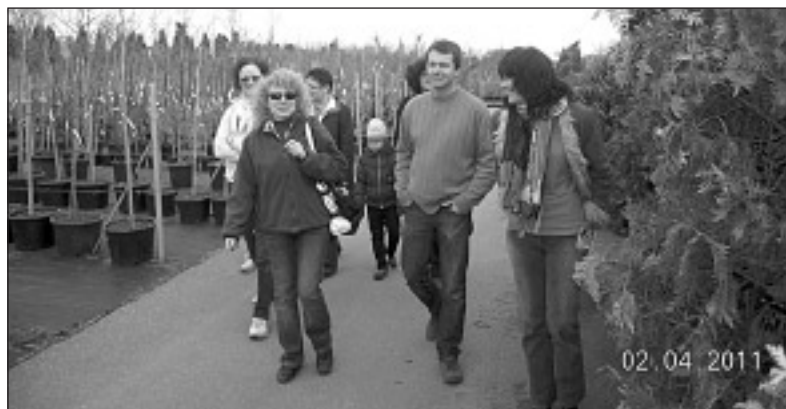
Zalesiańskie Koło Gospodyń w szkółce ogrodniczej w Runowie