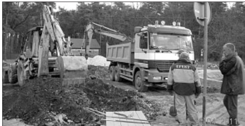
Dobiegają końca prace budowlane na ul. Wiekowej Sosny

Lider grupy „Razem Lepiej” Magda Kamińska