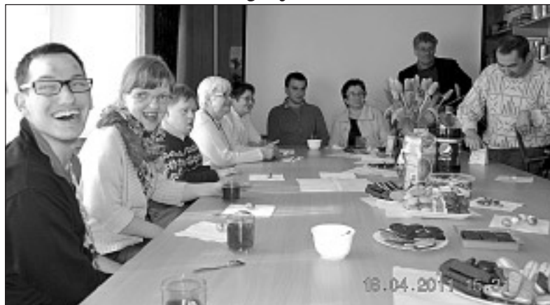
Filia CK po raz kolejny gościła członków grupy RAZEM LEPIEJ