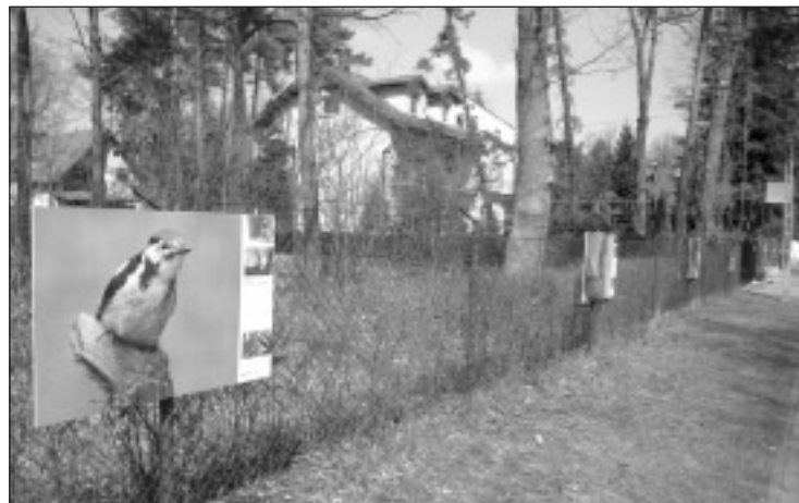
Wystawa fotografii Krzysztofa Merskiego na ul. Korolowych Dębów