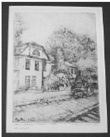
“Dworzec kolejki w Piasecznie” aut. Robert Lisowski, grafika, 40x32