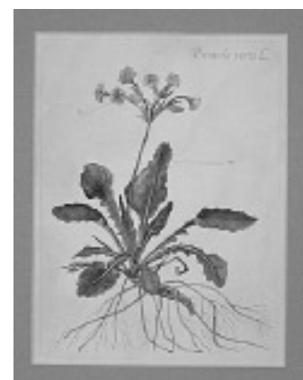
“Primula” aut. Blanka Gul, 35x28