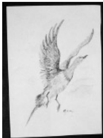
Rysunek, kredka – żuraw