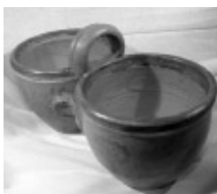
Dwojaki, ceramika, 21x37