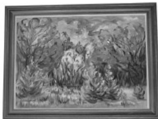
“Biele Chojnowskie” aut. Teresa Jędrzejczyk, 70x50