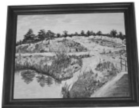
“Górki Szymona” aut. Sylwester Domosławski, 46x55