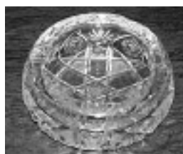
Popielniczka kryształowa, 5x13