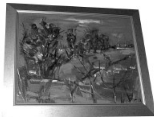
“Pejzaż” aut. Zbigniew Czajkowski, akryl, płótno: 81x65