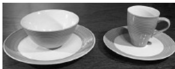
4-osobowy komplet stołowy ”DUKA”