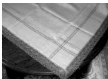
Obrus Iniany z