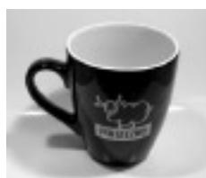
Kubek z logo Piaseczna