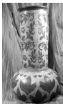
Wazon, ceramika, 42x25