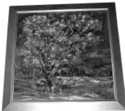
“Drzewo” aut. Zbigniew Czajkowski, olej, płótno: 80x80