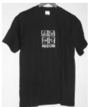
Koszulka z logo Piaseczna