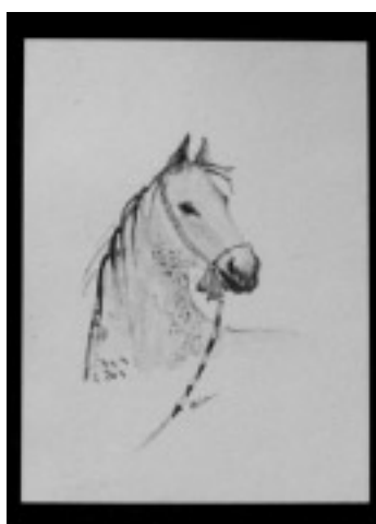
Rysunek, kredka – głowa konia