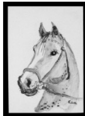
Rysunek, kredka – głowa konia