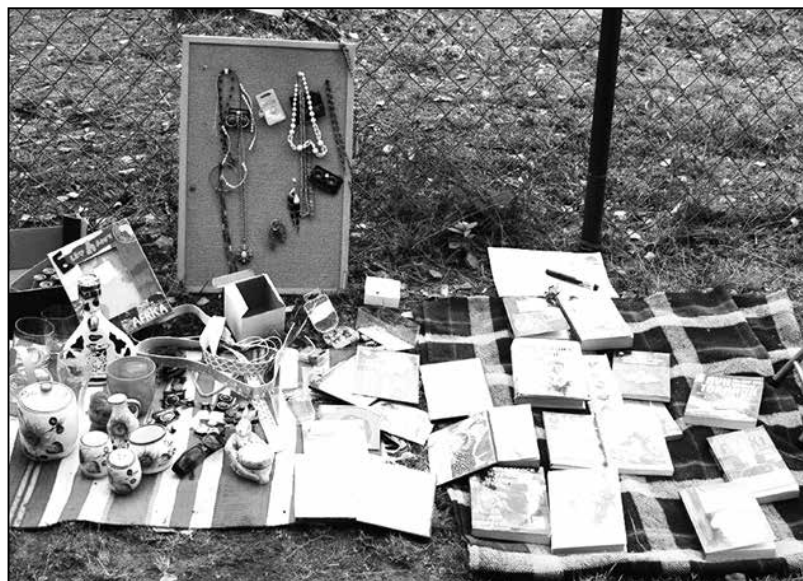
Rodzinne stoisko handlowe na Pieczonym Ziemniaku