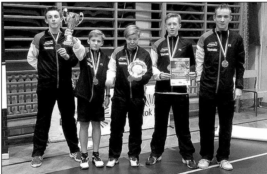
Hubertus brązowi medaliści Drużynowych Mistrzostw Polski 2014