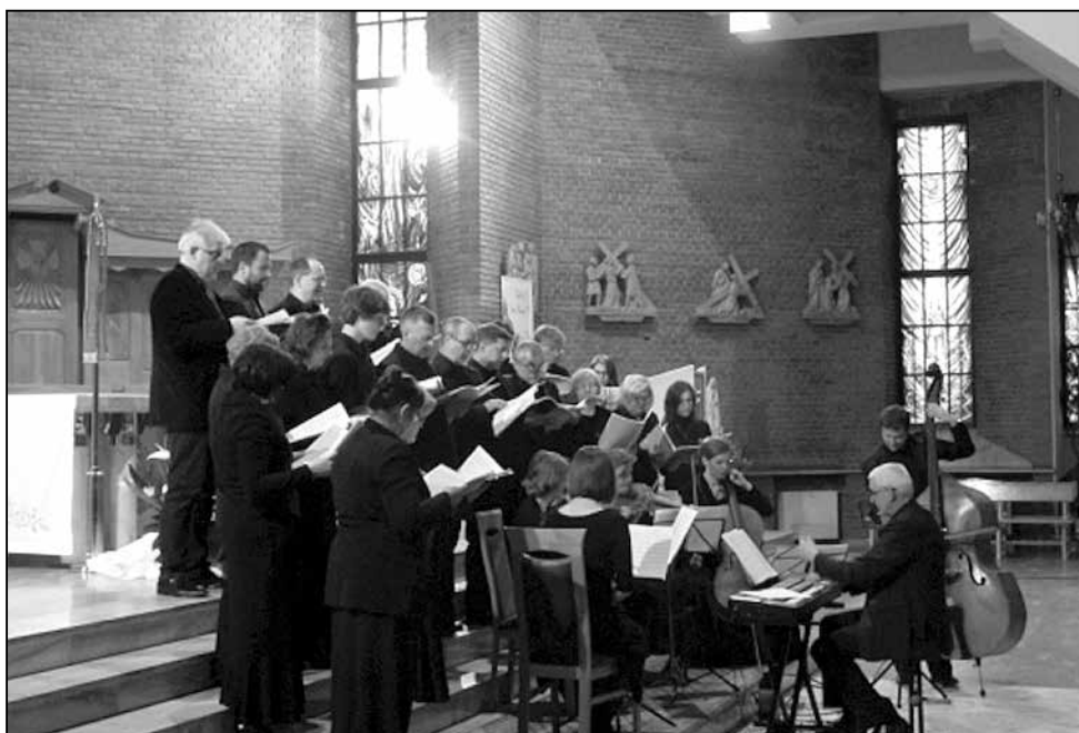
14 Encyklik w Białej Podlaskiej

Zalesiańskie Towarzystwo Śpiewacze jest już pełnoletnie. Mamy 18 letnią historię, która zaczęła się podczas wakacyjnego wyjazdu grupy parafialnej do Jadamowa, gdzie zwykliśmy wieczorami śpiewać kanony z Taize. Śpiewanie tych kanonów uprawialiśmy potem regularnie spotykając się co czwartek w naszym domu. Potem zaczęliśmy śpiewać utwory nieco trudniejsze; pieśni renesansowe Wacława z Szamotuł, Mikołaja Gomółki, wielogłosowe opracowania pieśni wielkopostnych, adwentowych i kolęd. Z naszym śpiewem często włączaliśmy się w uroczystości kościelne. W końcu przyszedł czas na próby