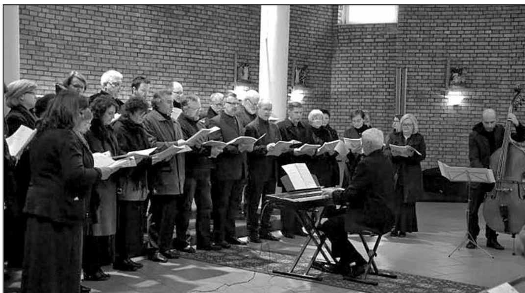
Chór ZTS śpiewa 14 Encyklik w Mrozach

pracowaliśmy nad oratorium mojej kompozycji zatytułowanym „14 Encyklik”. Oratorium to wykonaliśmy w tym roku kilkakrotnie: w Mrozach, Długiej Kościelnej, Białej Podlaskiej, Żabieńcu, Baniosze, Prażmowie. Nie tylko my wykonywaliśmy to oratorium w roku kanonizacji Jana Pawła II. Dzieło to wykonane zostało również przez chór Centrum Myśli Jana Pawła II z towarzyszeniem orkiestry w Katedrze św. Jana w Warszawie w dniu kanonizacji. Chór ZTS wzięli udział w uroczystej mszy odprawionej na rynku piaseczyńskim z okazji kanonizacji Jana Pawła II, gdzie wspólnie z 10 innymi