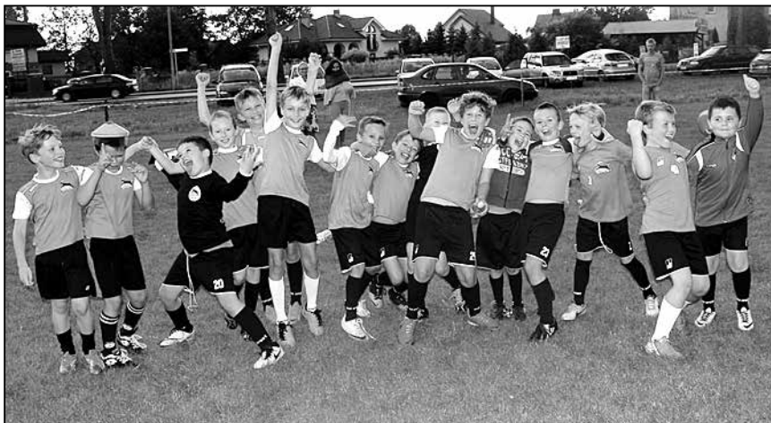
Piłkarze 2005,2006 po kolejnym wygranym meczu