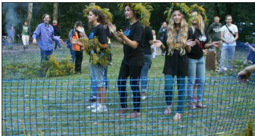
Młodzieżowy happening na Zimnych Dołach

Salon literacko-muzyczny zaprasza NA TEN NOWY ROK . . .