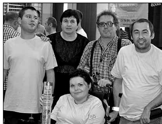
Kolejny puchar na Tataspartakiadzie