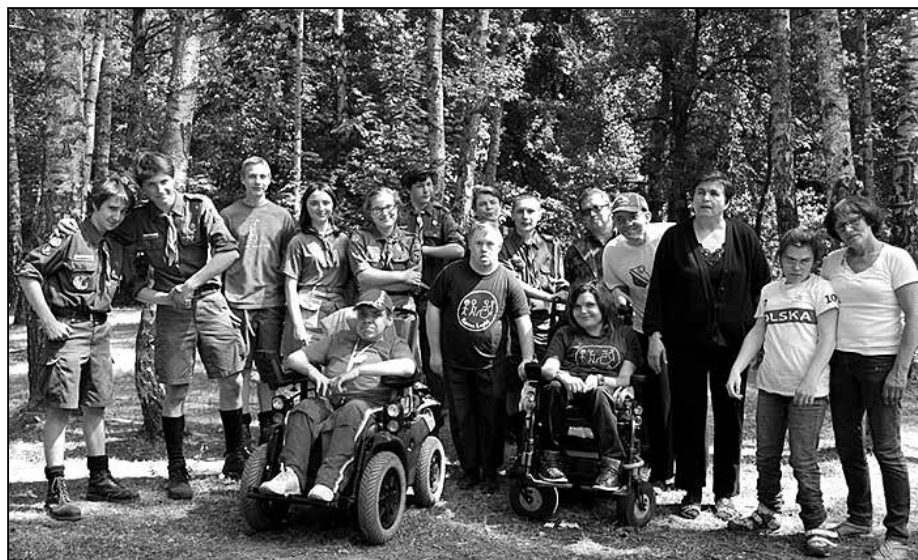
Wspólna gra harcerska z druhami z ZHR „Watra”